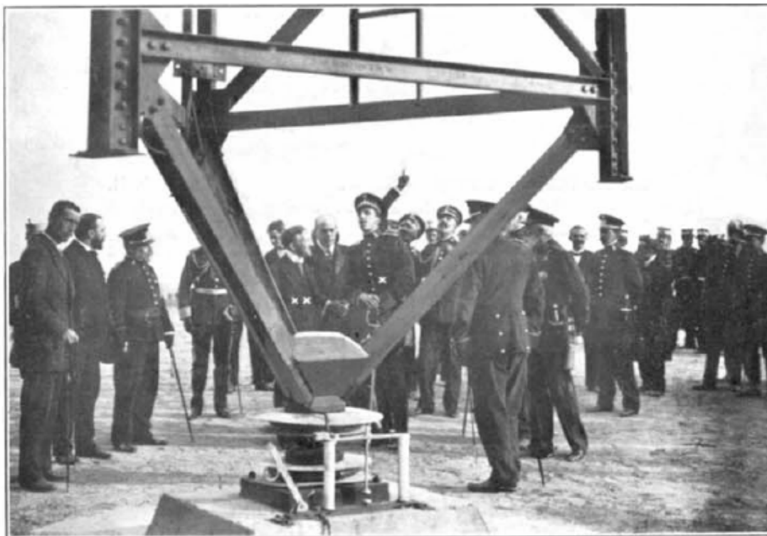
Visita de S.M. el Rey de España a la estación reabierto de Telefunken en Madrid